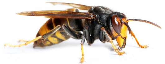
Frelon asiatique ( Vespa velutina )

Nous vous rappelons que la destruction des nids est prise en charge par la mairie.